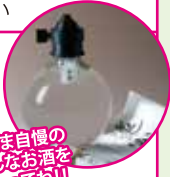
かどま自慢の色んなお酒を味わってね!!

フードは、大和田センター内 各専門店店頭でお買い求めください。すぐに食べていただけるように各専門店にて提供しています。